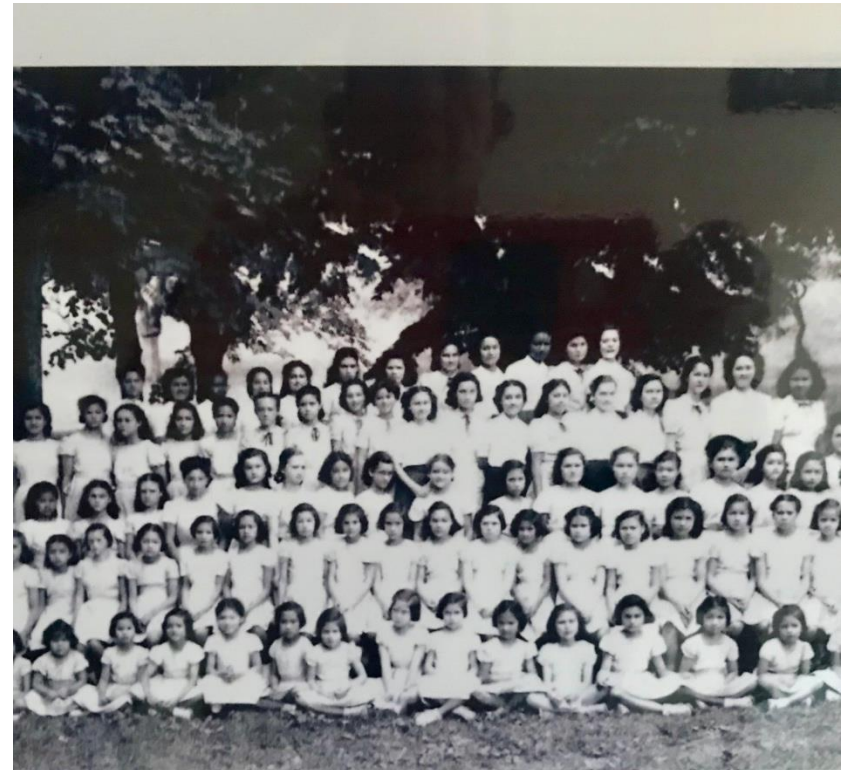
Les Eurasiennes à l'Abbaye de Saint Rambert-en-Bugey

En 2009, un petit groupe de nostalgiques des années vécues à Saint Rambert-en-Bugey, ont recommencé timidement à organiser des rassemblements à l'Abbaye. Et c'est ainsi qu'a été créée le 30 mars 2018 l'Amicale des Eurasiennes de l'Abbaye de Saint Rambert.